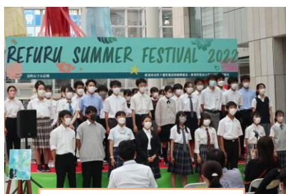
3学年古町ルフル特設 ステージでの合唱