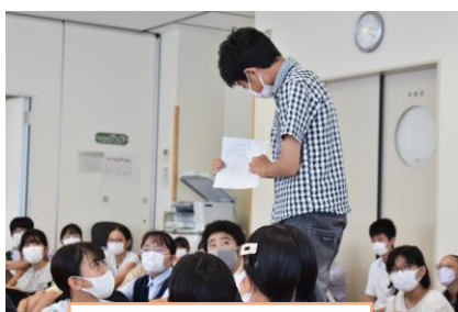
1学年附属新潟特別 支援学校との交流