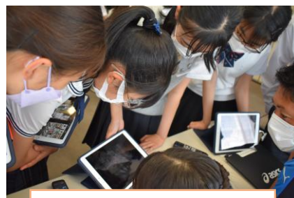
Action Dayで「にいがた 2km」取材したSAS部