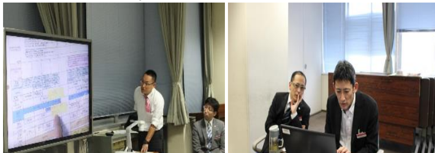
カリキュラムの共有やプログレスカード作成の様子

①長期休業中（春休み、夏休み、冬休み）に教科ごとに視覚的カリキュラムとプログレスカードを作成する