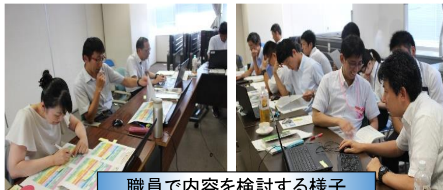
職員で内容を検討する様子

③生徒のプログレスカードのセルフレポートなどを基に、カリキュラムならびに資質・能力の再検討する